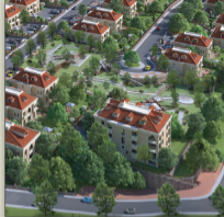
شقة (A2) بمساحة بناء إجمالية 220 م 2 + حق الانتفاع 24 م 2 عتبة